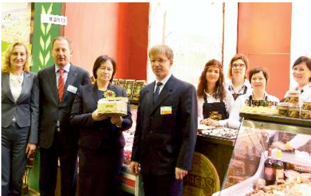
Mūsų stendą aplankė žemės ūkio ministrė Virginija Baltraitienė (trečia iš kairės) su delegacija.

„Žalioji savaitė“ buvo sėkminga, todėl viliamės, kad ir kitais metais Berlyne galėsime pristatyti produkciją naujiems ir mus pamėgusiems parodos lankytojams.