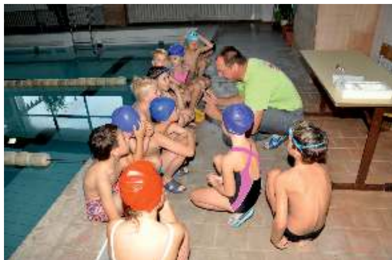
Kad ir labai nekantraudami, vaikai išklaušė instruktoriaus pamokymus, kaip elgtis vandenyje.

Per pusmetį mažieji baigs 24 valandų programą, dalyvaus parodomuosiuose plaukimuose, po kurių bus nuspręsta, kas dalyvaus finale. Taip pat bus atrinkti ir antrajame pusmetyje dalyvausiantys