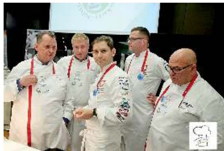
Restoranų šefai, dalyvavę renginyje CHEFS ONLY.

Įstabaus grožio miestelyje Mikolajki, Lenkijoje, įvyko kasmetis virtuvės ir kulinarijos šefų iš visos Lenkijos susitikimas – „Chefs Only“.