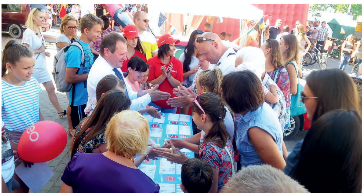
Nuotaikinga „pasiplėšymo“ akimirka Šilalės miesto šventėje.