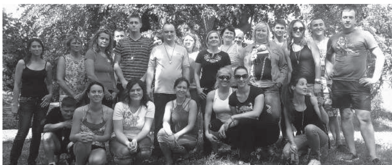
Prie 15-os kamienų liepos Papilėje.