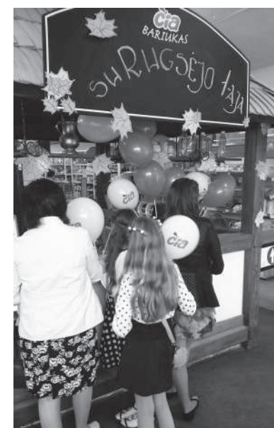
Mokslo ir žinių dienos šventė prie parduotuvės „Čia“ Dariaus ir Girėno gatvėje.

Panašios Rugsėjo 1-osios šventės surengtos Klaipėdoje, Palangoje, Biržuose, Skuode ir kitose „Čia Market“ tinklo parduotuvėse.