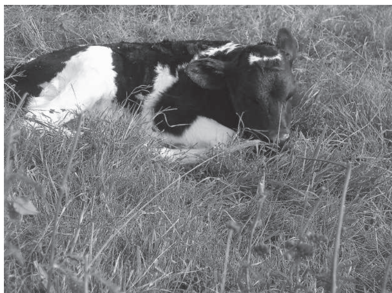
Kol melžėjai rungėsi, karvė Vienuolė atsivedė telyčaitę, kuri papildys Baršauskų bandą.