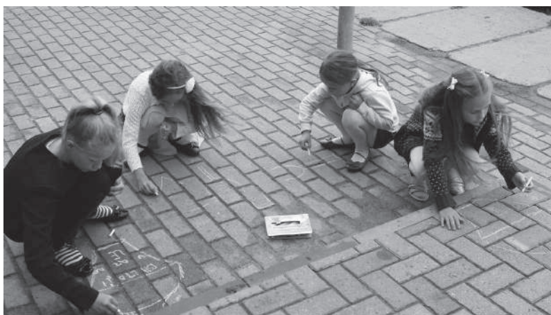
Vaikai rungėsi, kas ant grindinio nupieš gražesnę piešinių.

Jau dešimtmetį UAB „Čia Market“ darbuotojai puoselėja gražią tradiciją – Rugsėjo 1-ąją – Mokslo ir žinių dieną – sukviečia moksleivius prie „Čia“ parduotuvių ir jiems pateikia malonių staigmenų.