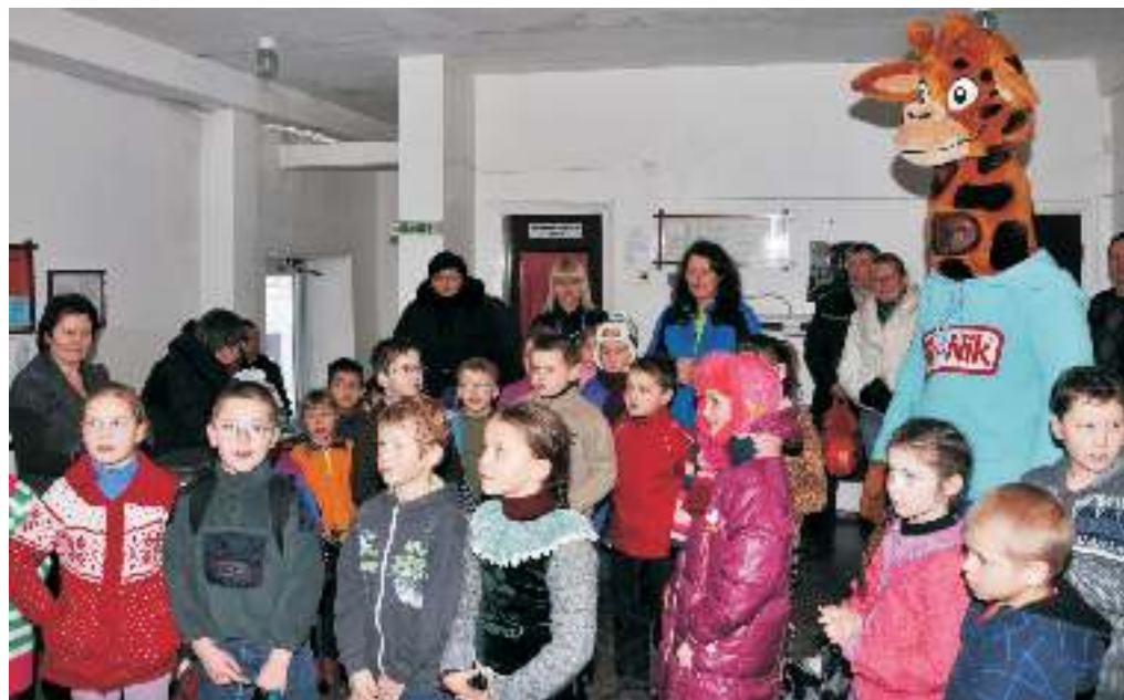
Jaunieji plaukikai su PIK-NIK plėšomų sūrio dešrelių personažu Žirafa.