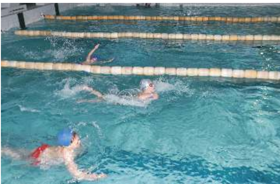
Parodomosiose plaukimo varžybose išaiškinami geriausieji, kurie rungsis finale.