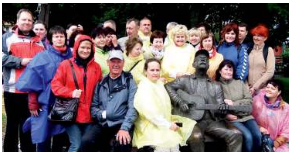
Darbuotojų motyvacijai skatinti vasarą suorganizuota kelionė į Nidą.