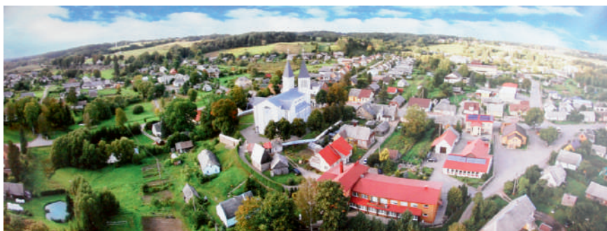
Kaitinėnai — iš paukščio skrydžio.