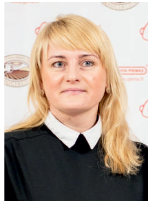
Geriausio ekologiško pieno gamintojas

Didkiemio k., Didkiemio sen., Šilalės r. Prekinio pieno kiekis iš vienos karvės vidutiniškai per 2017 m. IV ketvirtį – 14 kg Vidutinis prekinio pieno kiekis iš visų karvių per 2017 m. – 4309 kg