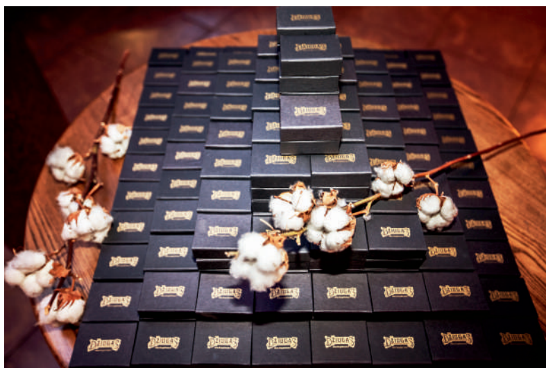
Atvykusieji į šventę sutikti maloniomis dovanėlėmis.