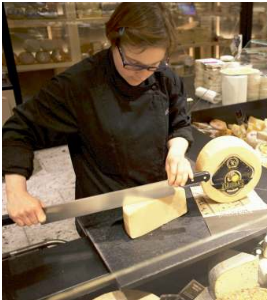
Prancūzai vis labiau vertina sūrį DŽIUGAS.