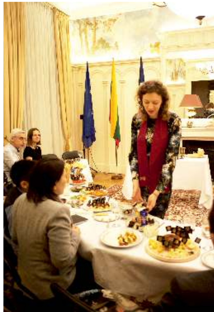
Degustacija Lietuvos Respublikos ambasadoje Paryžiuje.