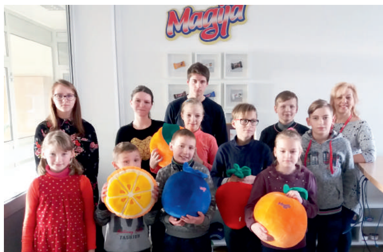
Piešinių konkurso nugalėtojai.