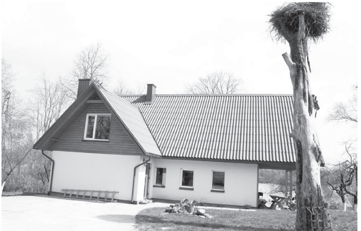
Gera gyventi rekonstruotoje sodyboje, kurioje tarsi jaučiamas trijų kartų prabėgusio laiko aidas.