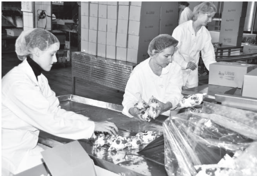
Ledai pakuojami į gatrokartono dėžes.

Virginijos Vaitkuvienės prisiminimus spaudai parengė Algirdas Dačkevičius