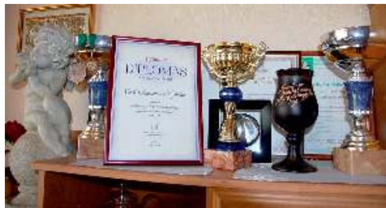
Pagarbioje vietoje saugomi apdovanojimai.