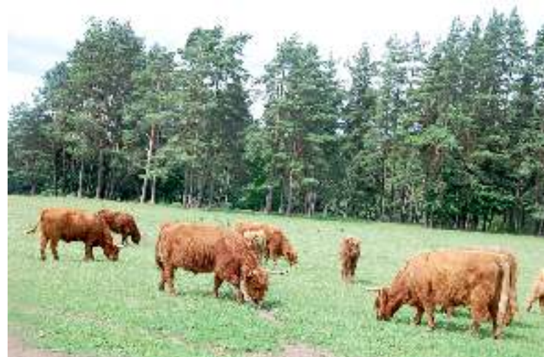
Prie kaimo turizmo sodybos ganosi hailandų banda.