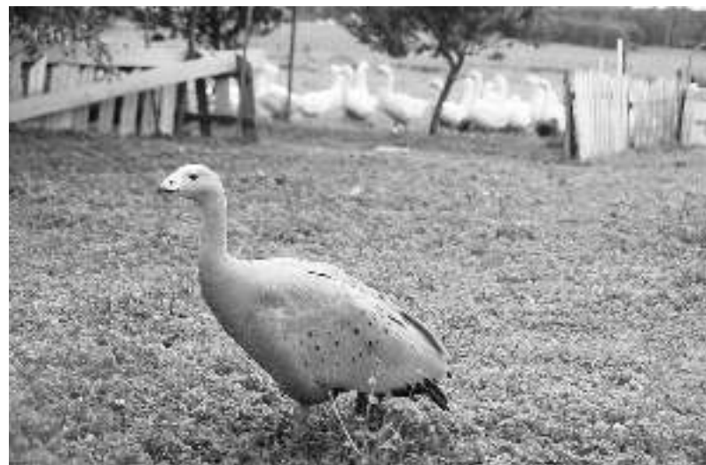
Smalsioji Australijos vištinė žąsis.