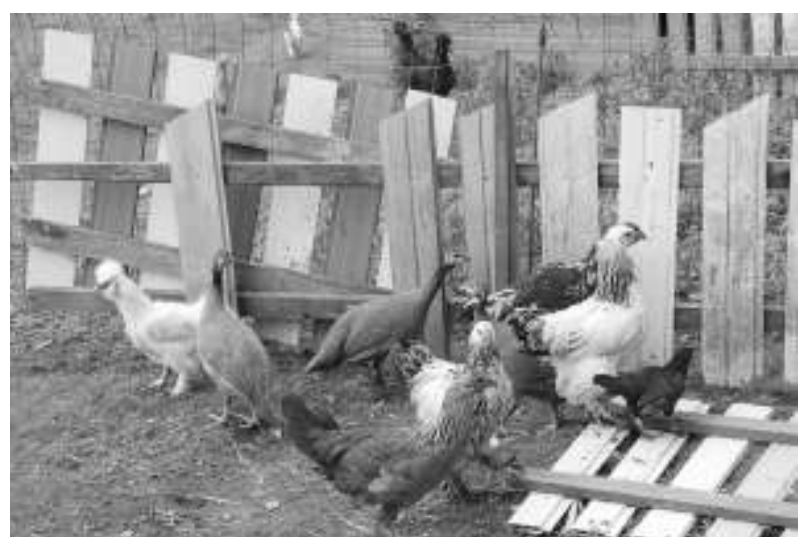
Įvairių veislių paukščiai gerai tarpusavyje sutaria.