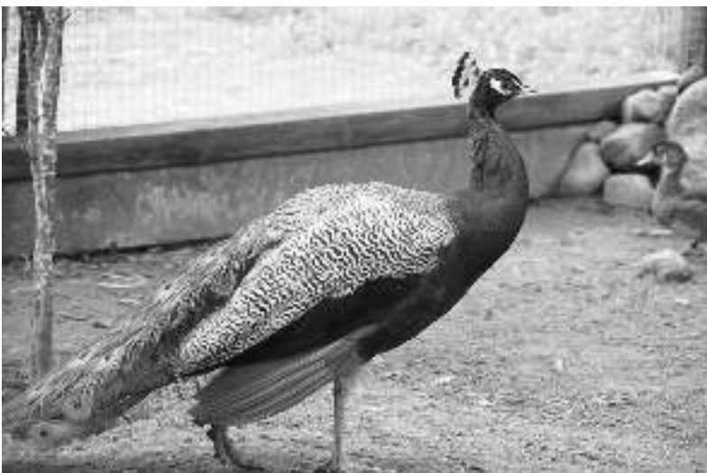
Mėlynasis indiškasis povas.

Vaikinas įsigijęs specialiosios literatūros apie įvairius paukščių rūšis, jų priežiūrą bei ligas.