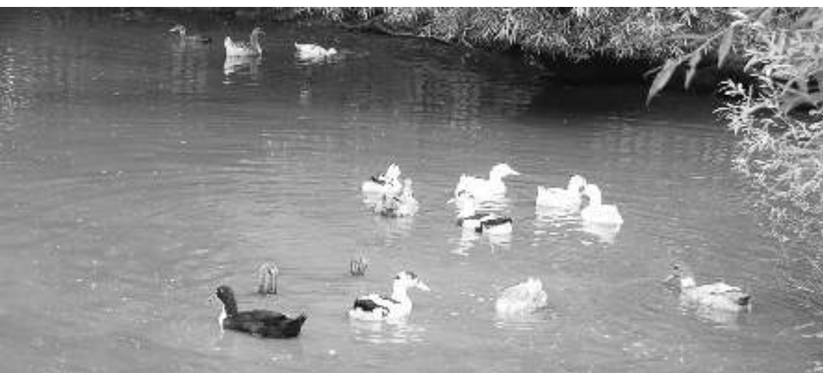
Vandens paukščiams gera turkštis tvenkinėlyje.